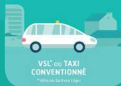
VSL* ou TAXI CONVENTIONNÉ *véhicule à faible vitesse

VOUS AVEZ BESOIN D'UNE AIDE POUR VOUS DÉPLACER, vous risquez des effets secondaires pendant le transport ou votre état de santé nécessite le respect rigoureux des règles d'hygiène.